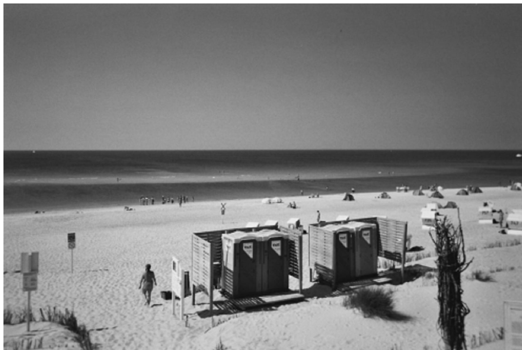
Photo 2 : La plage nudiste officielle (F.K.K.) de List, au nord de l'île de Sylt (Schleswig-Holstein). Août 2004.